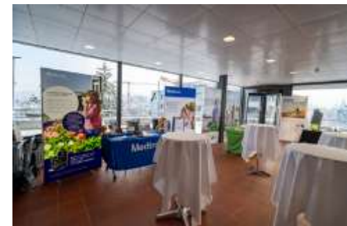
D1abetes-day 2024 (Deutschschweiz), Luzern