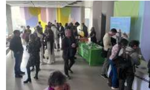
D1abetes-day 2024 (Romandie), Lausanne

Pour connaître les manifestations et événements prévus en 2024 : www.diabetesuisse.ch .